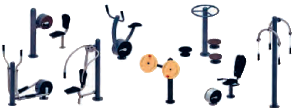
Fitness Corner at Block 318 Bukit Batok Street 32

Illustrations are an artist's impression. Actual development may differ.