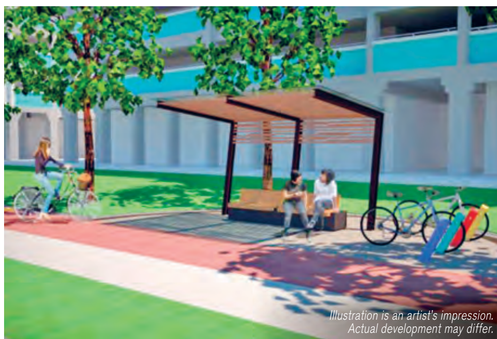
Illustration is an artist's impression. Actual development may differ.