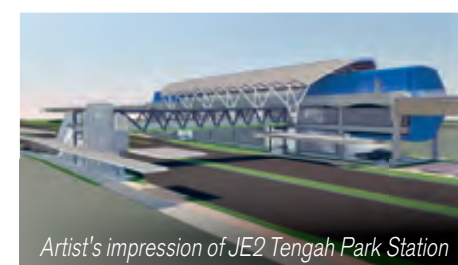
Artist's impression of JE2 Tengah Park Station