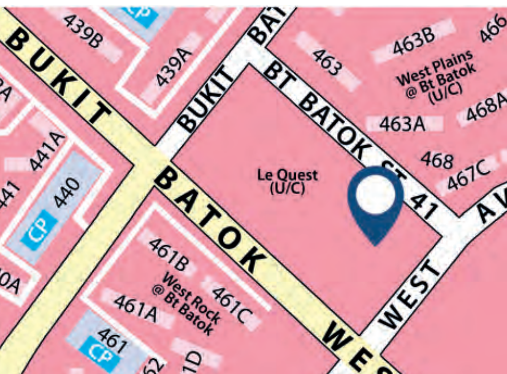
New Hawker Centre at Bukit Batok West Extension

Illustration is an artist's impression. Actual development may differ.