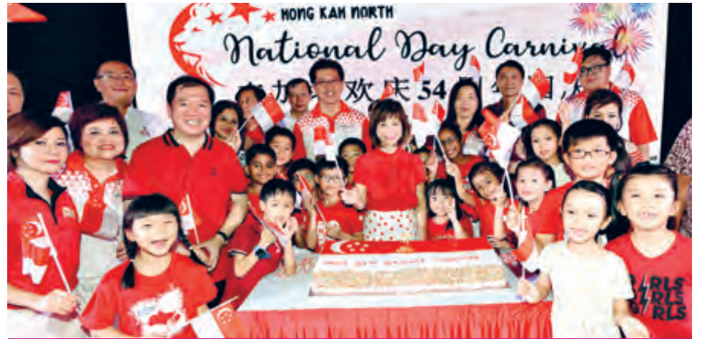
Celebrating National Day with Hong Kah North Residents.