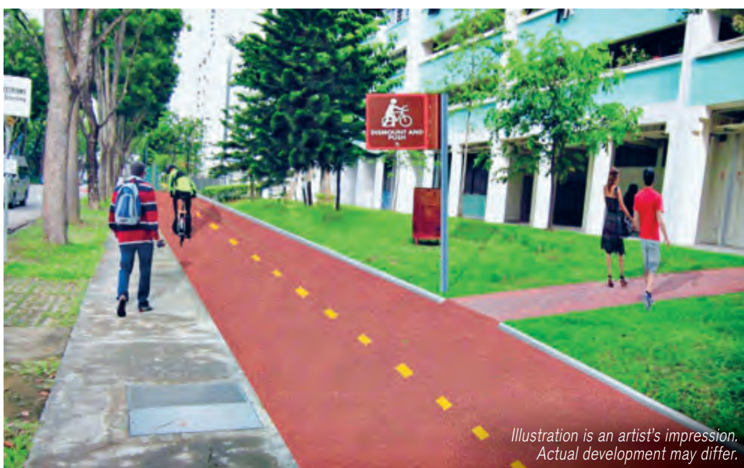
Illustration is an artist's impression. Actual development may differ.

Hong Kah North's Masterplan aims to further enhance the living environment and quality of life through the rejuvenation and revitalisation of various community and living spaces. The plan was developed taking into account community feedback and through careful deliberations. These exciting transformations are currently taking place, and here are what residents can anticipate: