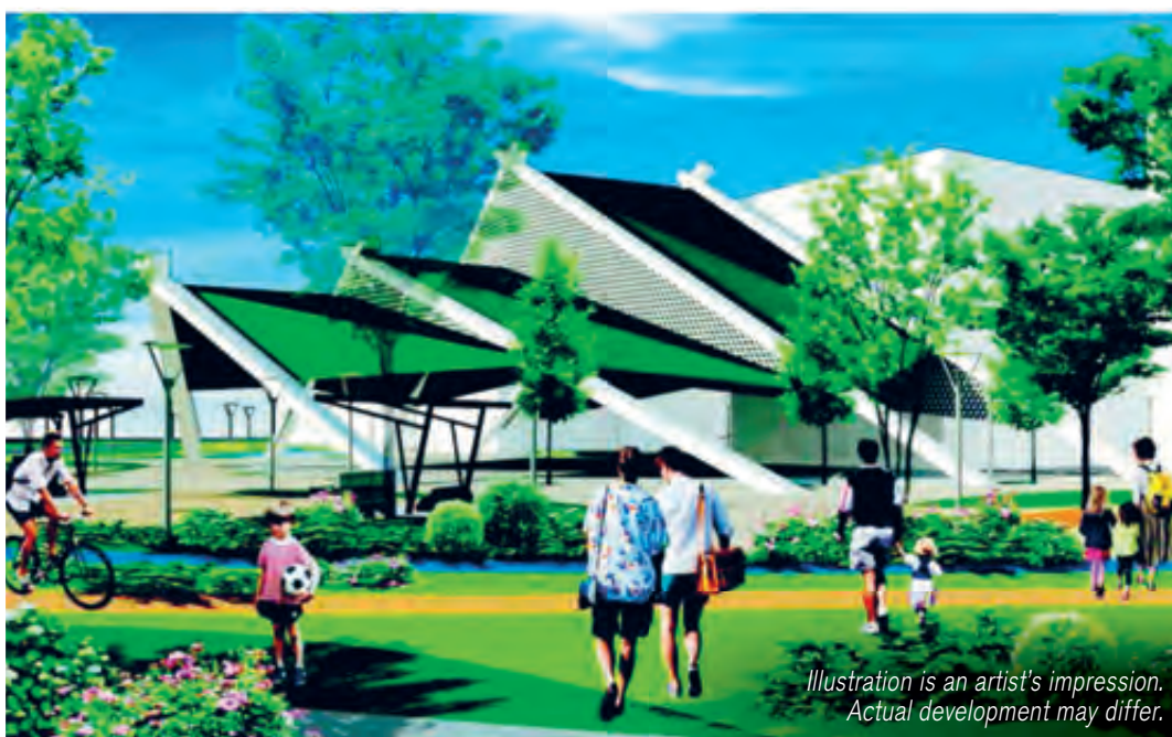
Illustration is an artist's impression. Actual development may differ.