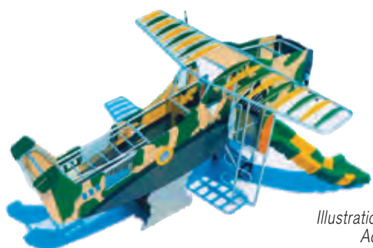
Upgrading of Playground

Illustrations are an artist's impression. Actual development may differ.