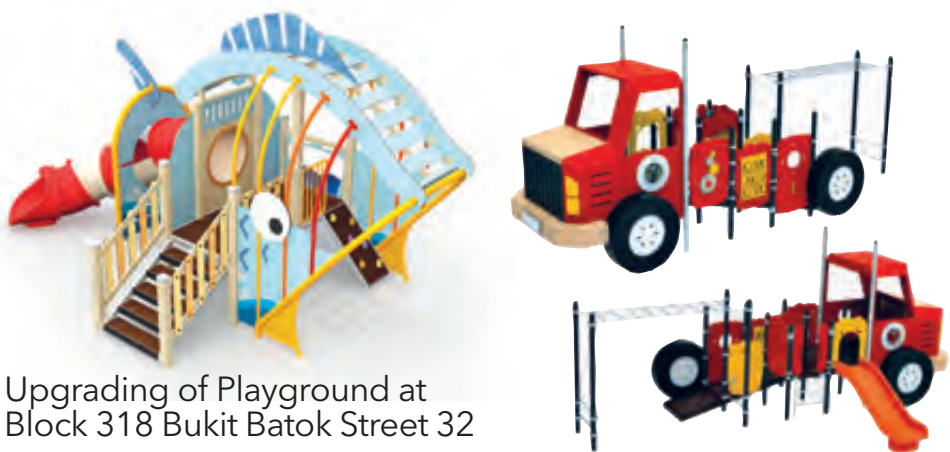
Upgrading of Playground at Block 318 Bukit Batok Street 32