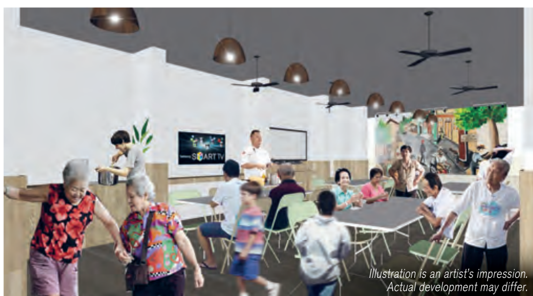
Kampong Café at Block 350

Illustration is an artist's impression. Actual development may differ.