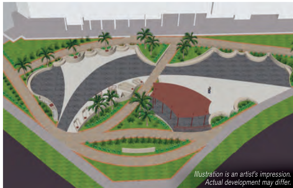
Illustration is an artist's impression. Actual development may differ.