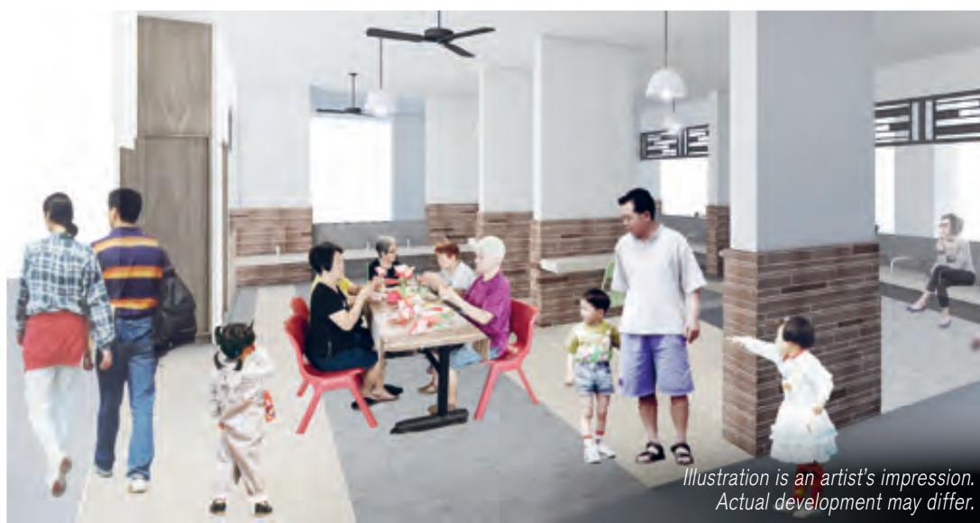
Kampong Café at Block 369

Illustration is an artist's impression. Actual development may differ.