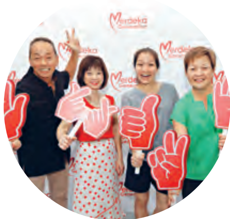
Appreciation event for Merdeka Generation at Hong Kah North.