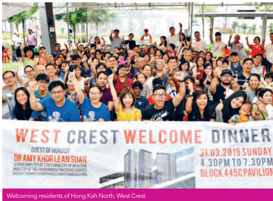
Welcoming residents of Hong Kah North, West Crest.