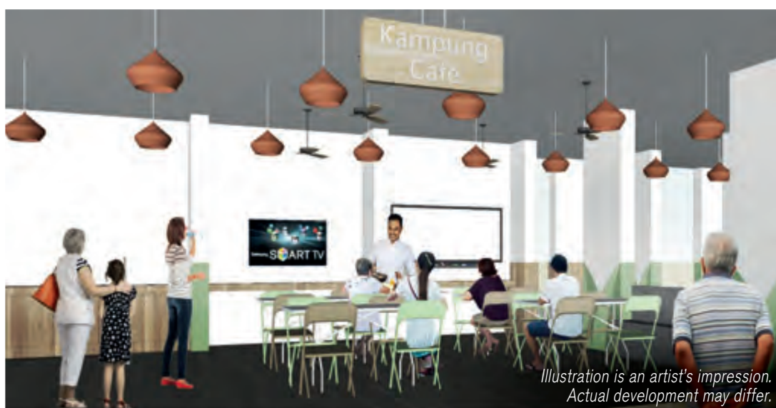
Kampong Café at Block 304

Illustration is an artist's impression. Actual development may differ.