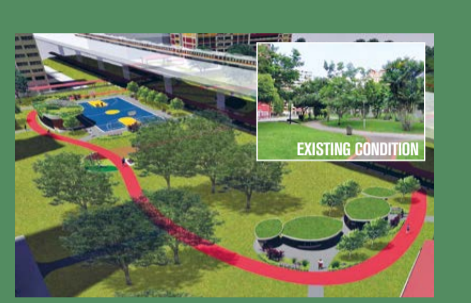
NEIGHBOURHOOD RENEWAL PROGRAMME (NRP) 202 blocks will benefit from this programme.