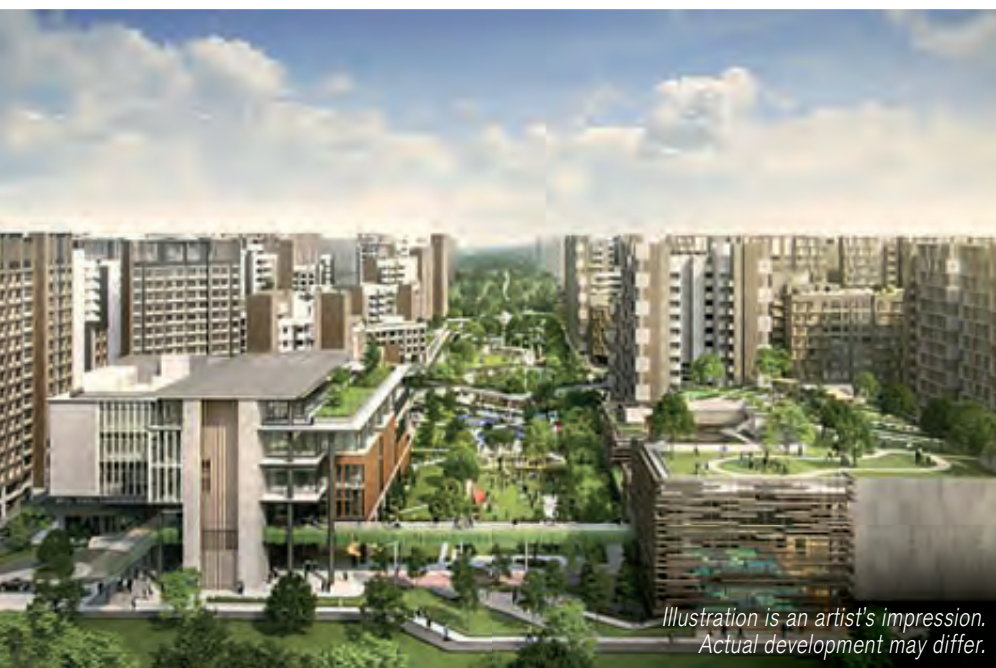
Illustration is an artist's impression. Actual development may differ.