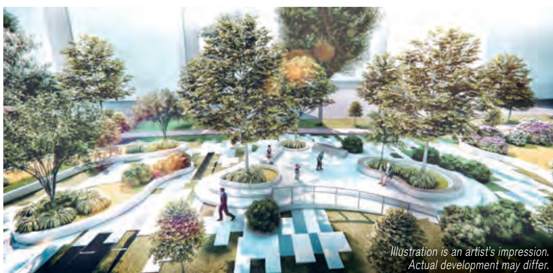
Neighbourhood Renewal Programme

Illustration is an artist's impression. Actual development may differ.