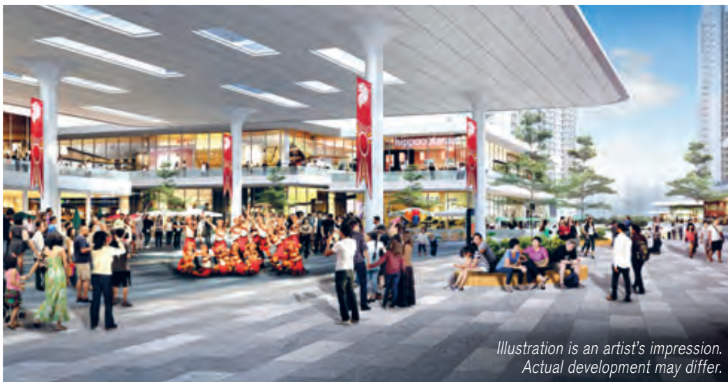
Illustration is an artist's impression. Actual development may differ.