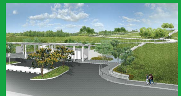
BUKIT GOMBAK PARK A 4.8-hectare park located at Bukit Batok West Avenue 5 is scheduled to be opened in 2020.