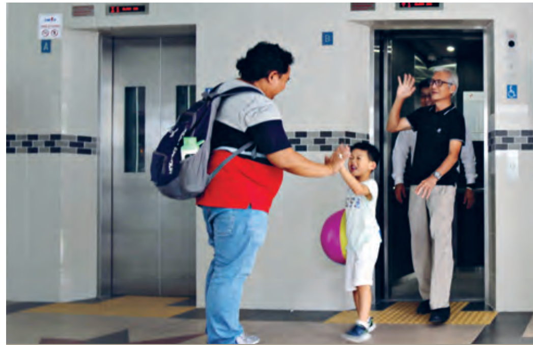
Lift Replacement and Enhancement Programme