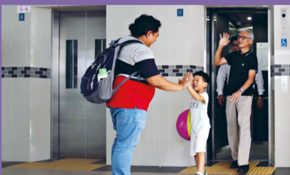
LIFT REPLACEMENT/ENHANCEMENT PROGRAMME 1,012 lifts to be replaced and enhanced.