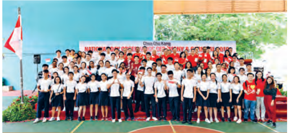
Adviser Mr Gan Kim Yong joining our youth in marking the nation's birthday.