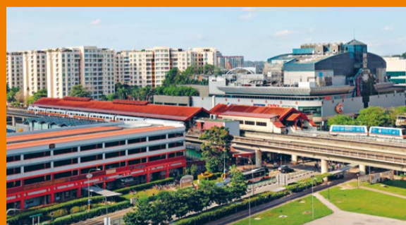
INTEGRATED TRANSPORT HUB Air-conditioned bus interchange that is linked to the LRT/MRT stations and adjoining commercial developments along the Jurong Region Line.