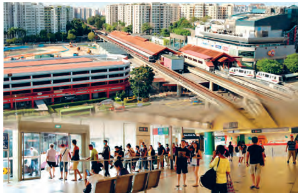
Integrated Transport Hub

Remaking Our Heartland (ROH) is a comprehensive programme to renew and further develop existing HDB towns and estates to meet the changing needs of the community.