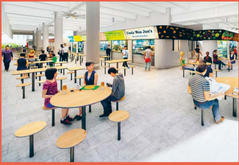
2 HAWKER CENTRES New eating places to provide residents with more dining options.

Renewing and revitalising the place we call home – that is the goal of our 5-Year Masterplan. These improvement works offer everything from new facilities that encourage a healthy lifestyle, to greater connectivity that keeps us closer to our loved ones. Here are the 10 major projects that you can look forward to: