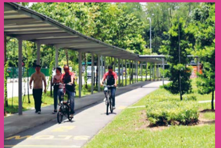
WIDENED FOOTPATH AND CYCLING PATH A new 8.6-kilometre route for cyclists to explore.