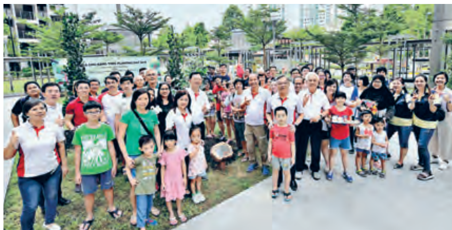
Residents, young and old, coming together to help green our environment during Chua Chu Kang Tree Planting Day.