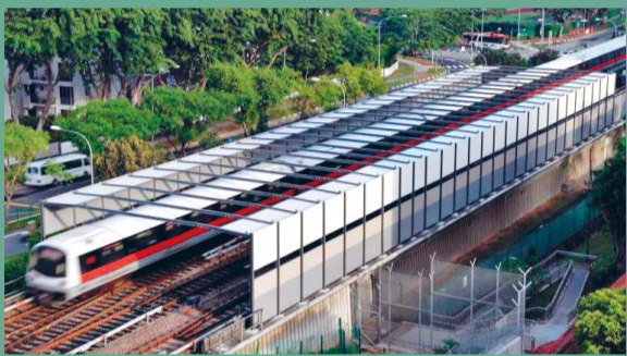
SOUND BARRIERS (COVERING UP TO 2,900 METRES) Installed along MRT viaducts, these barriers aim to reduce noise levels.