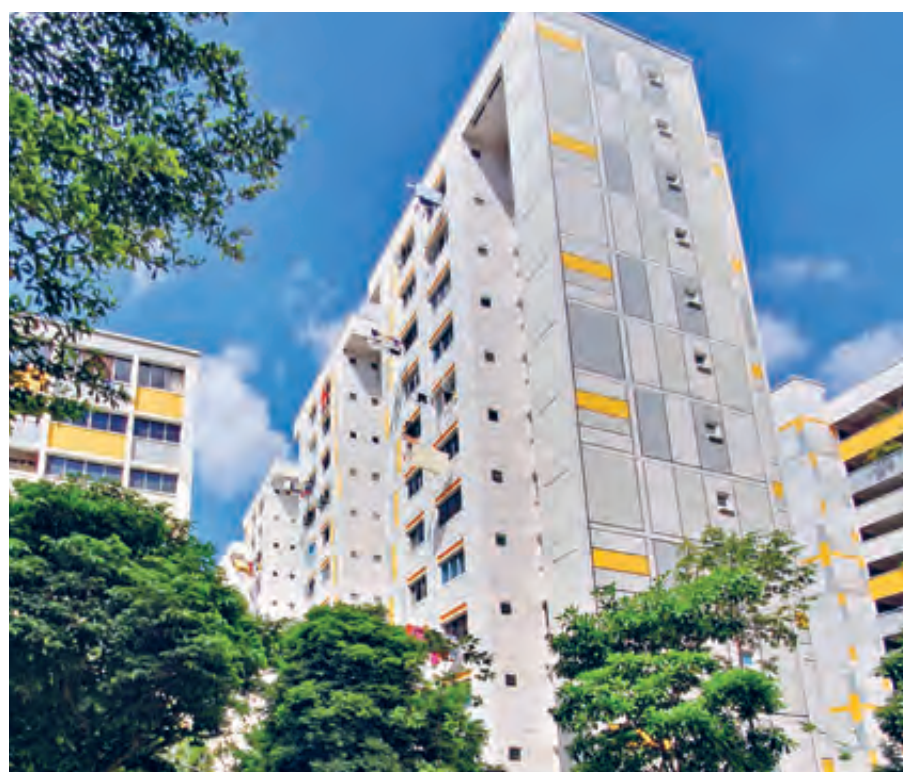
Repairs and Redecoration Programme