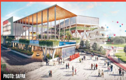
SAFRA CHOA CHU KANG The new clubhouse, which opens in 2022, will be the first to offer a sheltered pool and aqua gym.