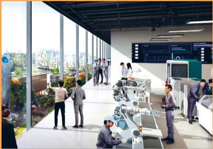
JURONG INNOVATION DISTRICT A 600-hectare hub for advanced manufacturing.