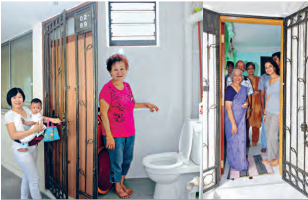
Home Improvement Programme

Our plan to enhance the quality of life through the rejuvenation and revitalisation of living spaces was conceived after careful planning and community feedback. These exciting transformations are currently taking place, and here are what residents can anticipate: