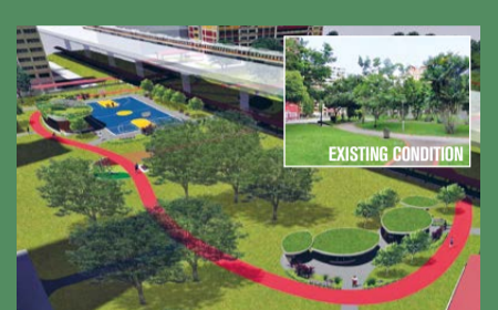
NEIGHBOURHOOD RENEWAL PROGRAMME (NRP) 202 blocks will benefit from this programme.