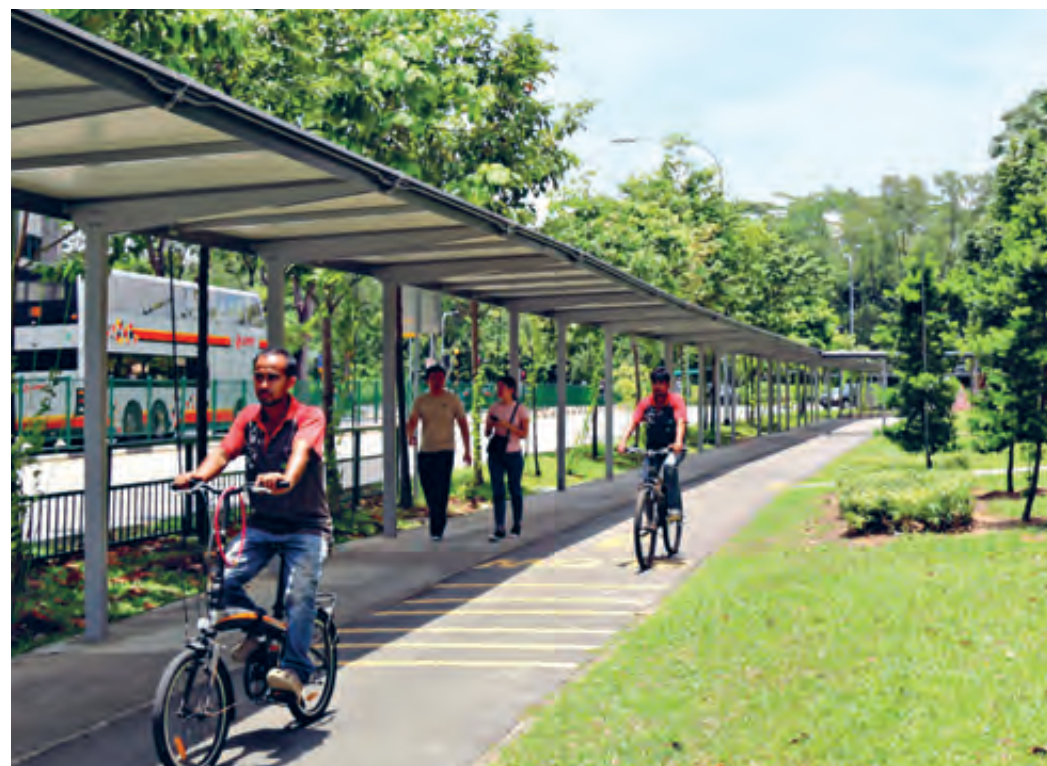
Widened Footpath and Cycling Path