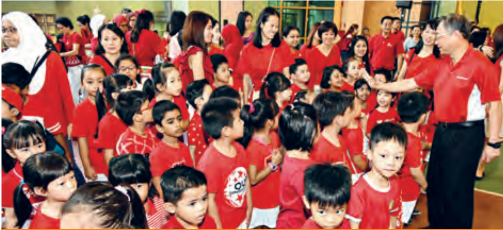
Celebrating National Day with Chua Chu Kang pre-schoolers and their teachers.

A look back at some beautiful memories forged with our family, friends and neighbours at various community events.