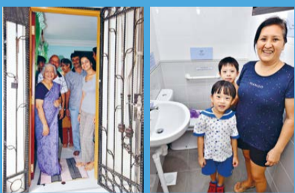
HOME IMPROVEMENT PROGRAMME (HIP) 9,322 units will benefit from this programme.