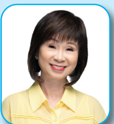
Dr Amy Khor Lean Suan Senior Minister of State Ministry of Sustainability and the Environment & Ministry of Transport MP for Hong Kah North SMC Vice-Chairman of Chua Chu Kang Town Council