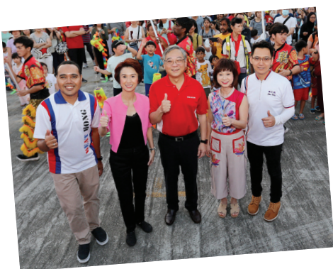
"A joyful time for the big CCK family! Enjoying a wonderful sunset picnic together at Hillview with residents celebrating Chingay @ Heartlands!"

MPs Zhulkarnain Abdul Rahim, Low Yen Ling, Gan Kim Yong, Dr Amy Khor Lean Suan and Don Wee (left to right)