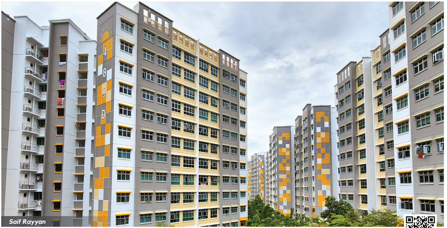
Bright hues of yellow and orange dot Brickland's Sunshine Gardens with jubilant cheer.