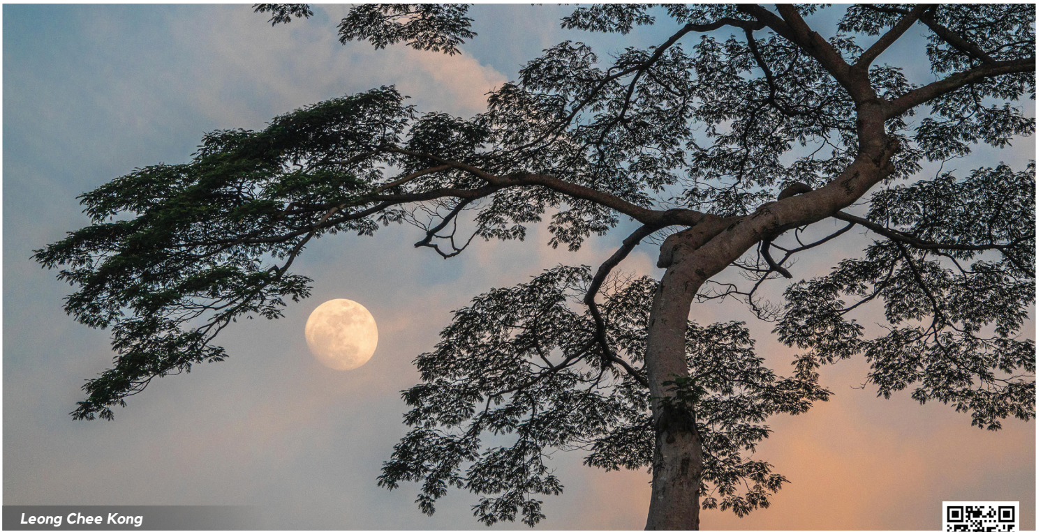
Leong Chee Kong