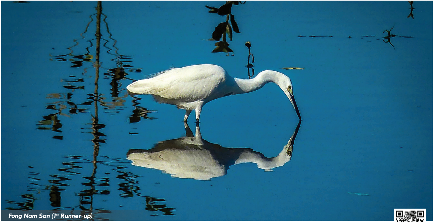
Fong Nam San (1 st Runner-up)