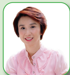
Ms Low Yen Ling Minister of State Ministry of Trade and Industry & Ministry of Culture, Community and Youth Mayor of South West District MP for Chua Chu Kang GRC Chairman of Chua Chu Kang Town Council