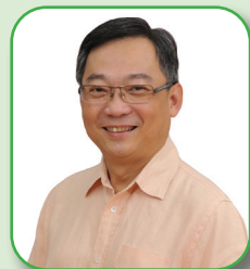
Mr Gan Kim Yong Minister for Trade and Industry MP for Chua Chu Kang GRC